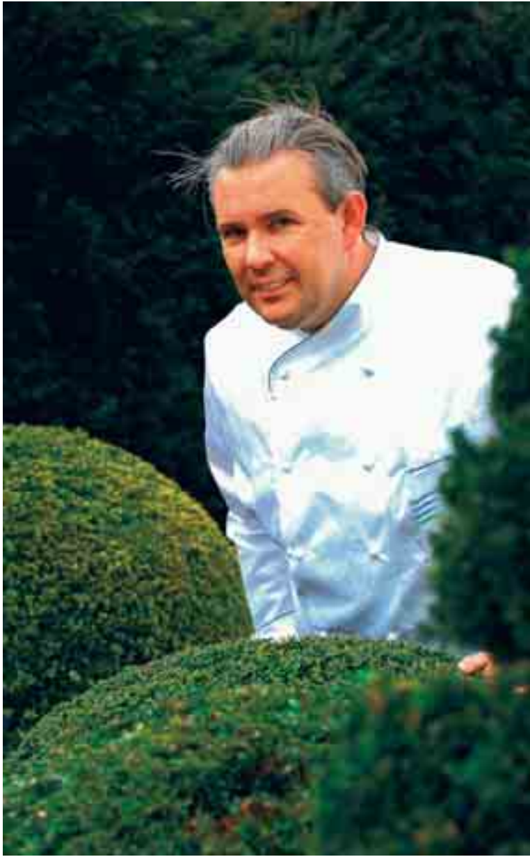
Peter Goossens, kok en controlefreak.

Het 34-jarige popidool Robbie Williams gelooft in geesten en heeft ook al drie keer een ufo zien vliegen. Dat onthulde hij in een interview met collega Joss Stone op de Britse televisie. 'Ik wil geen popster meer zijn. Ik ga fulltime ufo's en buitenaardse wezens bestuderen', vertelt hij aan The Sun . 'Mensen denken dat ik gek ben en dat ben ik ook.' Robbie beweert zijn eerste ufo waargenomen te hebben als kind, een tweede vliegende schotel zag hij tijdens een verblijf in Beverly Hills. Nog wat later zag hij plots 'een grote gouden bal' aan de hemel.